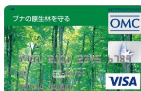
ブナの原生林を守る