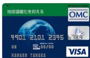
地球温暖化を抑える